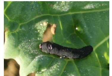
Larve de tenthrède de la rave sur colza.

Seuil indicatif de risque : 25% de la surface foliaire détruite par les larves de tenthrèdes.