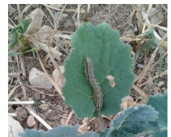
Figure 2 : Héliothis sur colza

Hors réseau, des signalements d'héliothis sont rapportés. Attention à la confusion parfois possible avec la tenthrède, lorsqu'en fin de cycle larvaire, l'héliothis prend une teinte plus sombre. Le seuil indicatif de risque à retenir est identique à celui des autres larves défoliatrices telles que la tenthrède, à savoir 25% de surface foliaire détruite. La culture du colza est sensible jusqu'à 6 feuilles.