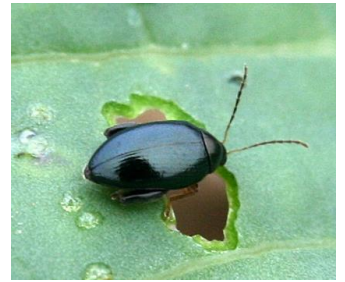
Grosse altise sur colza.

Le début du vol enclenché il y a deux semaines se poursuit. Il se généralise sur le territoire avec des captures dans 30 des 31 parcelles faisant l'objet d'un relevé en cuvette enterrée. Nous relevons en moyenne 16 insectes par pièges (en augmentation vs semaine dernière). L'observation en cuvette ne sert qu'à détecter l'arrivée dans les parcelles et la dynamique d'activité.