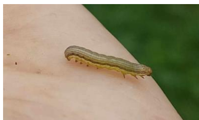
Une des chenilles Cirphis observée à Briscous de taille 1cm.

Des morsures ont été observées sur un site : SAINT-PEE-SUR-NIVELLE.