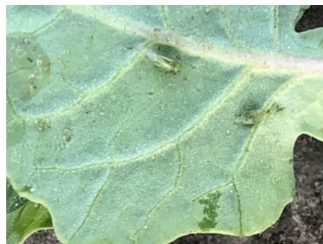
Pucerons verts au dos des feuilles M. Roux-Duparque (CA02)

Seuil indicatif de risque : 20% des plantes porteuses de pucerons durant les 6 premières semaines de végétation (soit jusqu'au stade 6 feuilles environ)