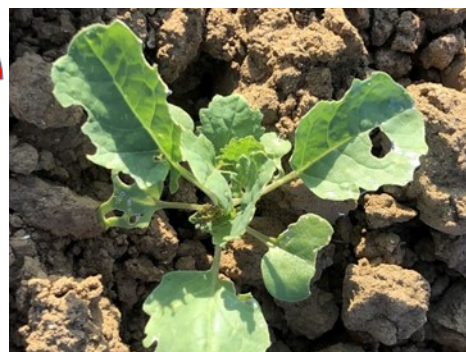
Dégâts de limaces sur feuille M. Roux-Duparque (CA02)

Evaluation du risque: se reporter au BSV précédent.