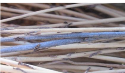
Photo 1 : Lin en cours de rouissage atteint de verticilliose

Sur les lins en cours de rouissage, des micro-sclérotés noirs se développent abondamment autour de certaines tiges, leur donnant un aspect bleu métallique (symptômes les plus caractéristiques). On peut également les observer à l'intérieur des tiges les plus touchées.