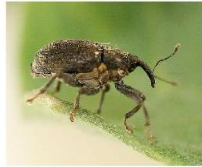
Charançon du bourgeon terminal adulte Terres Inovia

Le charançon du bourgeon terminal possède un corps noir brillant de 2,5 à 3,7 mm et avec une pilosité courte et clairsemée. L'extrémité de ses pattes est rousse et son dos présente des tâches blanchâtres. Les adultes sont discrets et pondent dans les pétioles durant l'automne. Ces pontes donnent lieu à des larves blanches sans patte possédant une tête brune. Ces larves font entre 4,5 et 6,5 mm. Au stade rosette, les larves peuvent passer dans le cœur des plantes et détruire le bourgeon terminal. Les plantes touchées présentent un aspect buissonnant au printemps.