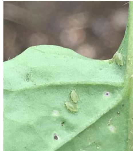
Présence de pucerons verts sur la face inférieure des feuilles

Pour les variétés non résistantes, le seuil indicatif de risque est fixé à 20 % de pieds porteurs de pucerons jusqu'au stade 6 feuilles (BBCH 16) ou 6 semaines de végétation.