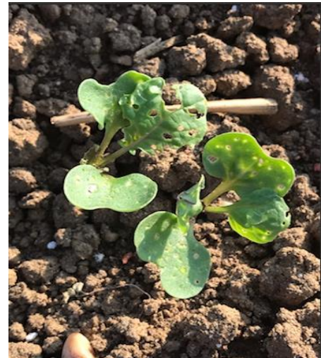
Dégâts d'altise sur la parcelle de Bischwiller