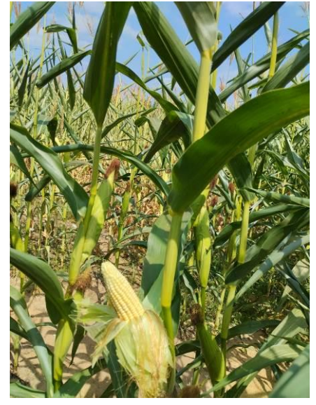
Maïs à Nexon (87) semis le 17/04 V LACORRE CDA 87