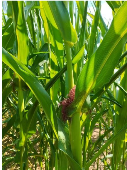
Maïs à Nexon (87) semis le 06/06 V LACORRE CDA 87