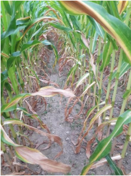
Maïs à Meste (19) JR LOGE CDA 19