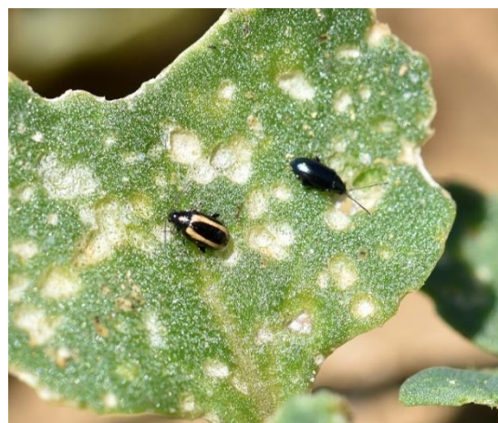
Dégâts de petites altises

Observer en priorité les bordures de parcelle, notamment à proximité des anciens champs de colza.