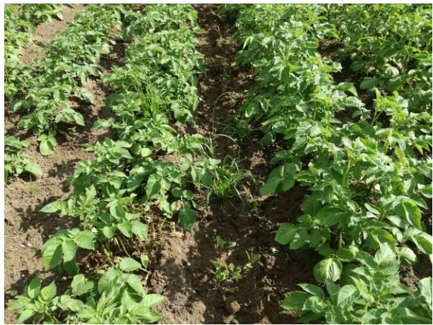
Variétés AGRIA-CEPHORA à gauche, SIRTEMA-CAROLUS à droite