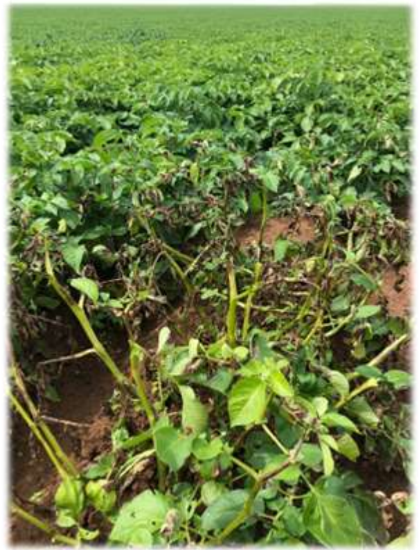
Foyer de mildiou en parcelle, secteur Neuvy en Dunois (B. Delarue)