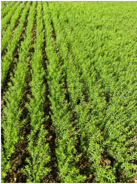
Lin à 15 cm

Dans beaucoup de situations, l'eau n'est pas le facteur limitant à la croissance des lins, ce serait plus les températures. Les lins ont malgré tout pu profiter de températures favorables fin de semaine dernière pour accélérer leur croissance. Ci où là, des épisodes orageux sont survenus.