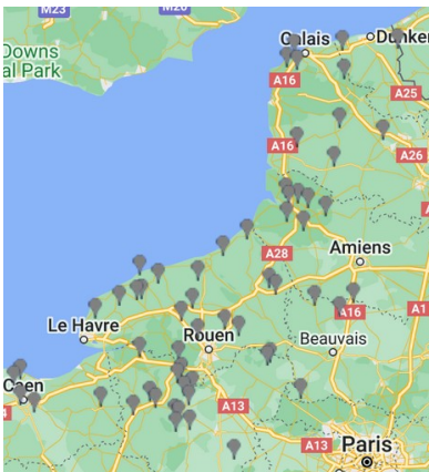
Réseau d'observation cette semaine

Cette semaine, le réseau est constitué de 37 parcelles :