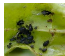
Colonie d'aptères noirs

Leur population est souvent régulée par les auxiliaires et nécessite rarement une intervention.