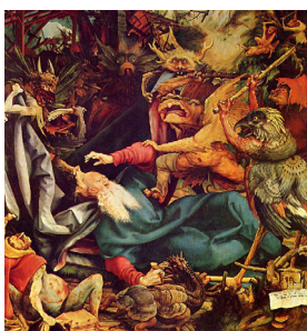
Tentation de Saint Antoine, Matthias Grünewald (1512-1516)

A plus faible dose, l'ergot produit également de nombreux effets