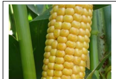
Le stade lentille vitreuse, un bon repère pour prévoir la date optimale de récolte

A partir de ce stade, il faut en moyenne 150 degrés-jours, base 6-30°C, pour atteindre le stade optimal pour la récolte fourrage, 32-33% MS plante entière. Cela correspond à une durée comprise entre 15 et 25 jours, selon la région et les conditions climatiques. Attention, en situation de fort stress hydrique l'évolution du taux de matière sèche du maïs peut être très rapide.